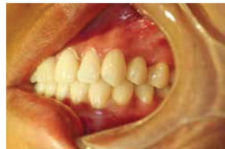
Fig. 23: Crown on implant 5 years