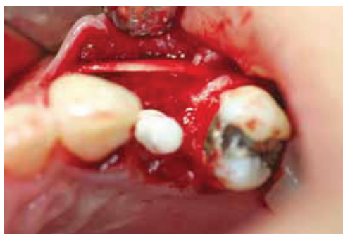
Fig. 11: Membrane collagen