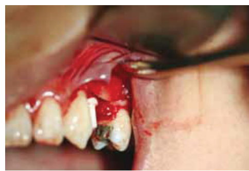
Fig. 12: Membrane collagen-buccal view