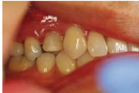
Fig. 14: Four Months post-surgery