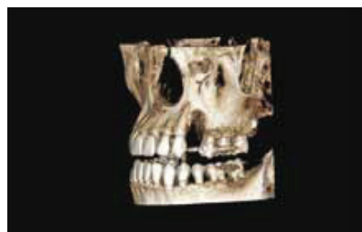
Fig. 2 : Pre-Op 3D