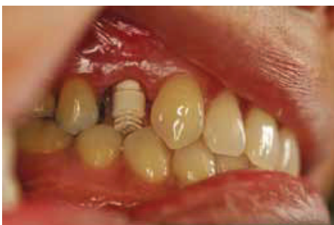
Fig. 15: Impression Cap

Four months after implant placement, based on clinical examination ( Picture #14 ) and after determining adequate implant stability, it was decided that for functional and aesthetic purposes, the implant would be restored with a porcelain fused to zirconia (PFZ) crown. In other words the coping would be zirconia and porcelain in this case would be pressed over it. The excess soft tissue that covered the restorative margin of the implant was removed with a diode laser, a pick up PEEK impression cap was placed over the implant abutment ( Picture #15 ). Conventional impressions were made with light and medium body polyvinylsiloxane impression material, the cap was picked up in the impression ( Picture #16 ),