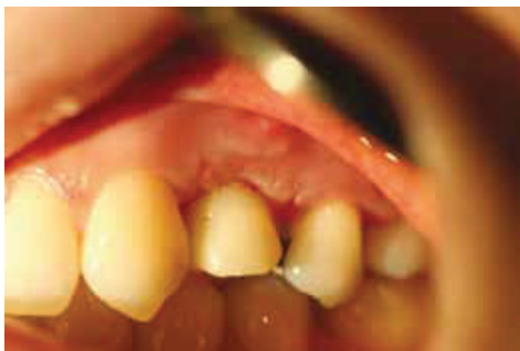
Fig. 13: Two weeks post-surgery