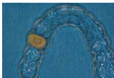
Fig. 5 : Essix appliance