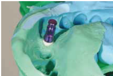
Fig. 17: Analog

an analog placed, soft tissue model made and a stone model was poured ( Pictures #17, #18 and #19 ). Once the crown was received from the dental laboratory the challenge was to bond two ceramics namely the abutment and the crown together in a predictable manner. The intaglio of the crown was decontaminated ( Picture #20 ) with Ivoclean (Ivoclar AG, Germany) and the abutment cleaned with alcohol.