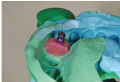
Fig. 18: Soft tissue model