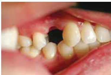
Fig. 1 : Pre-Op

The treatment sequence would consist of two phases starting with placement of a zirconia ceramic implant with simultaneous ridge augmentation and the possibility of immediate temporization. Alternatively impressions were also made in order to fabricate a removable implant protective device ( Picture #5 ) for the patient to wear during integration time in the event immediate temporization would not possible. Four months later the implant would be restored with a porcelain fused to zirconia crown.