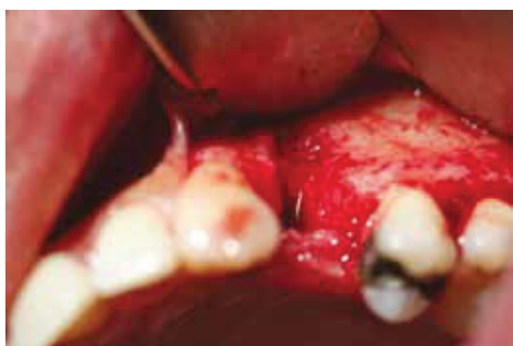
Fig. 7 : Socket

Un nombre total de cinq carpules de lidocaïne 2% avec 1 /100.000 d'épinéphrine ont été administrées par la méthode d'infiltration se limitant quadrant maxillaire gauche. Une incision intra-sulculaire a été faite. L'alvéole a ( Image 7 # ) été rincée et curetée avec une piézochirurgie à ultrasons (Mectron, Italie) avec la pointe de diamant en forme de poire. Comme observé sur le CBCT initial, l'ostéotomie a commencé dans une position légèrement palatine tout en engageant le forage pilote dans l'os inter-radulaire ( Photo # 8 ). L'ostéotomie a été réalisée de façon séquentielle sous irrigation avec les forets céramiques Zirkolith indiqués pour la configuration de l'implant sélectionné.