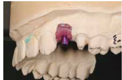
Fig. 19: Stone model

Le pilier et la couronne ont été ensuite traités avec Z-Prime (Bisco, USA) ( Photo # 21 ) et reliés de manière permanente avec une résine modifiée et un ciment verre ionomère ( Photo # 22 ). La patiente a été satisfaite du résultat esthétique et fonctionnel. Elle est revenue pour un contrôle sans doléance ni incident à signaler. La patiente est revenue également cinq ans après, la restauration et l'implant étaient stables et fonctionnels ( Photo # 23 ).