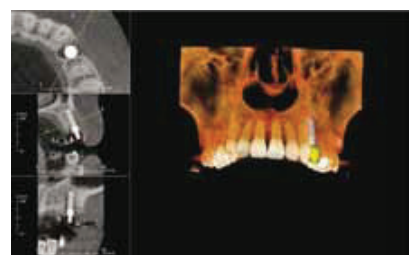
Fig. 6 : Virtual implant planning