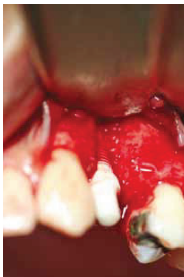
Fig. 9 : Immediately post implant placement