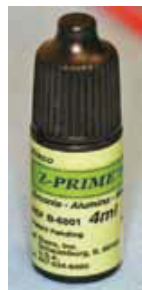
Fig. 21: Z-prime primer