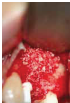
Fig. 10: Bone graft cancellous

The periostest is an instrument that measures implant stability by means of assessing the damping of the implant upon electromechanical percussion it allows for an objective assessment of implant integration progress (4). The values (PTV) observed range from -8 to +50 with -8 being the highest measurement value of implant stability. Implant stability testing was done immediately after placement and PT values of an average of -3.2 were observed. Most of the implant buccal threads were exposed and guided bone regeneration ( Picture #10, #11 and #12 ) was done using allogenic mineralized cancellous bone (Puros, Zimmer) and a resorbable membrane (Epiguide, Curasan AG, Germany). Given the favorable PTV, it was decided to proceed with direct immediate temporization of the implant using the Poly Methyl Methacrylate (PMMA) temporary crown that was initially placed in the removable protective Essix appliance ( Picture #5 ). Two weeks later the