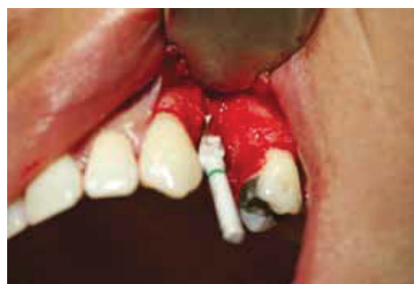
Fig. 8 : Osteotomy

At the time of surgery, the patient was administered topical anesthetic. A total of five carpules of Lidocaine 2% with 1/100.000 epinephrine was administered by method of infiltration only in the areas extending from distal tooth # 11 to mesial tooth #14 buccally and palatally . An intra-sulcular incision was made and it extended from mesial of tooth #14 to distal of tooth #12. The four-walled socket ( Picture #7 ) was rinsed and curetted with an ultrasonic piezosurgery (Mectron, Italy) using the pear-shaped diamond tip. As observed on the diagnostic CBCT, the previous tooth was bi-rooted and as planned the osteotomy was started slightly palatally and engaging the pilot drill in the inter-radicular bone ( Picture #8 ). The osteotomy was performed under sequential drilling using profuse irrigation with the Zirkolith ceramic drills indicated for the selected implant configuration.