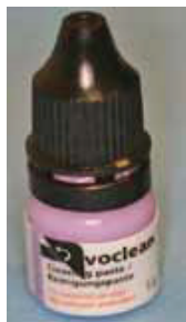
Fig. 20: Ivoclean

Both abutment and crown were then primed with Z-Prime (Bisco, USA) ( Picture #21 ) and permanently bonded with a resin modified glass ionomer cement ( Picture #22 ). The patient was satisfied with the aesthetic and functional outcome of this top-to-bottom metal free tooth replacement; she returned for uneventful post-crown delivery visit and at five years both the restoration and implant were stable and functional ( Picture #23 ).