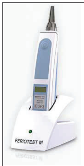
Fig. 9a: Periostest M

Le Periostest (Photo # 9a) est un instrument qui mesure la stabilité de l'implant au moyen de l'évaluation de l'amortissement de l'implant lors de percussions électromécaniques et cela permet une évaluation objective de l'évolution de l'intégration de l'implant (4). Les valeurs (PTV) observés allant de -8 à +50 avec -8 comme étant la valeur la plus élevée en termes de stabilité de l'implant. Les tests de stabilité de l'implant ont été faits immédiatement après la pose de l'implant et des valeurs d'une moyenne de -3,2 ont été observées. Puisque le filetage de l'implant était visible sur la face vestibulaire, une greffe de régénération osseuse guidée ( Image # 10, # 11 et # 12 ) a été faite en utilisant de l'os spongieux allogénique et minéralisé (Puros, Zimmer) et une membrane résorbable (Epiguide, Curasan AG, Allemagne). Compte tenu des valeurs PTV favorables immédiatement après la pose de l'implant, il a été décidé de procéder à la temporisation immédiate de l'implant en utilisant la couronne provisoire en poly méthacrylate de méthyle (PMMA) qui avait été initialement placé dans l'appareil Essix de protection amovible ( Photo n ° 5 ).