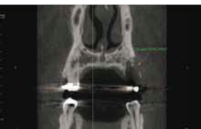
Fig. 4 : Coronal view