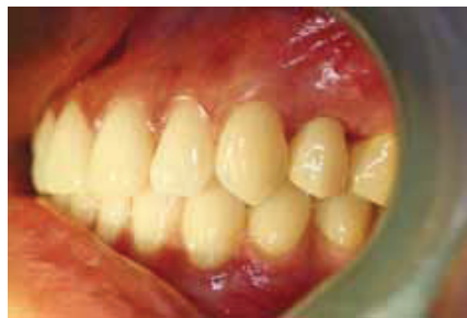
Fig. 22: Crown Delivery